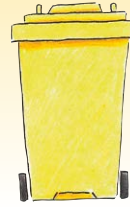
Gelbe Tonne Gelber Sack

Nicht in die Restmülltonne: schadstoffhaltige Abfälle, Bauschutt