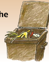
Biotonne für organische Abfälle

Glas und Papier, Produkte aus Kunststoff, Metall und Verbundstoff, die keine Verpackungen sind (z. B. Spielzeug, Windeln, Elektrokleingeräte, Folien vom Renovieren)