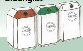
Glas sortiert nach Weiß-, Grün- und Braunglas

Nicht in das Altpapier: beschichtetes Papier, Fotos, Hygienepapier, Getränke- und Milchkartons, Tapeten, Wachs- und Pergamentpapier, verschmutztes Papier