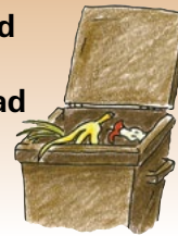
Biološki otpad Kontejner za organski otpad