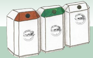
Staklo – Razdvojeno na belo, žuto i staklo braon boje