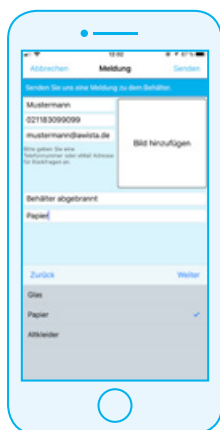
Schritt 3: Persönliche Daten eingeben, Meldegrund und Abfallart wählen