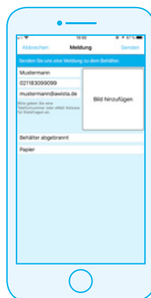
Schritt 4: Auf das Feld rechts tippen und Foto machen, „ok“ drücken