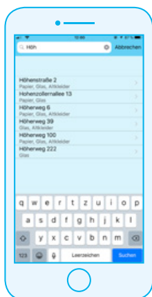
Schritt 1: Auswahl des Grundstücks in der Funktion „Depotcontainer“