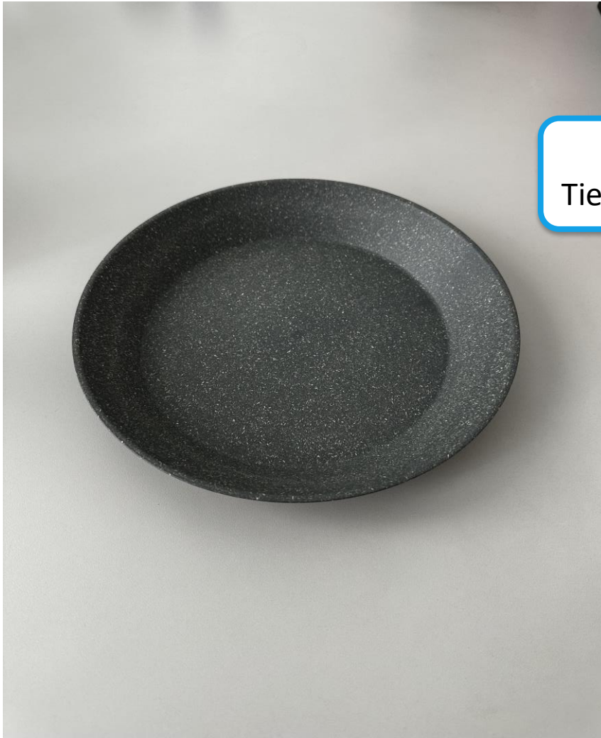
Connect Plate Tiefe Teller / 240 c 240 x 33 mm

Connect Plate ist ein tiefer Teller, der durch seine Vielseitigkeit und sein elegantes Design überzeugt.